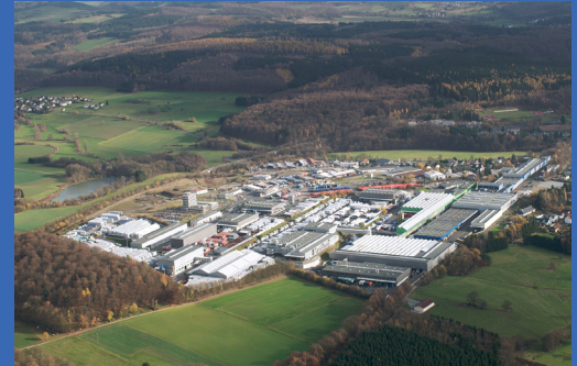
SCHÜTZ GmbH & Co.KGaA, Selters